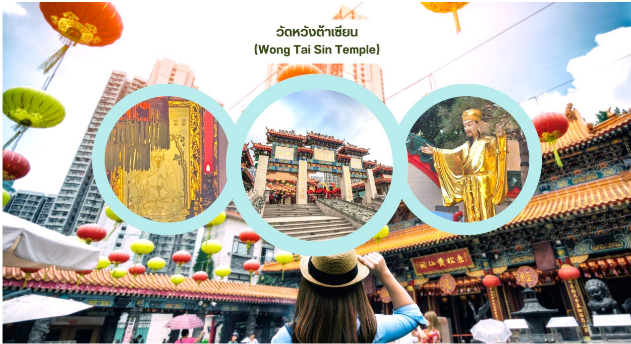
วัดหวังต้าเซียน (Wong Tai Sin Temple)

นำท่านเดินทางสู่ วัดหวังต้าเซียน (Wong Tai Sin Temple) หรือ ชิกชิกหยวน ห่วงไท่ซิน ขอพรท่าน ห่วงไท่ซิน ที่เชื่อกันว่า “สามารถประทานพรให้ทุกคำขอ” สักการะเทพเจ้าไฉ่ซิงเอี้ยะ เทพเจ้าแห่งความร่ำรวยที่จะนำพาโชคลาภมาให้ เลื่องลือในด้านกรให้พรโชคลาภ ความเจริญรุ่งเรือง ความร่ำรวย และการประสบผลสำเร็จจากสิ่งทีขอไว้ โดยทางวัดจะมีรูปและแผ่นทองให้คนละ 1 ชุด เพื่อนำไปปิดทองลงบนองค์ไฉ่ซิงเอี้ยะ เริ่มจากการไหว้ขอพร และตั้งจิตอธิษฐานด้านนอก นำธูปไปปักลงบนกระถางโดยใช้มือซ้ายเท่านั้น จากนั้นเจ้าหน้าที่จะเปิดประตูให้เข้าไปด้านใน ก่อนเข้าไปเจ้าหน้าที่จะแจกถุงพลาสติกสำหรับสวมหุ้มรองเท้าอีกที ด้านในจะมีซินแสคอยแนะนำวิธีการขอพรให้อย่างละเอียด วิธีการขอพรให้เดินวนตามเข็มนาฬิกาอบเทพเจ้าไฉ่ซิงเอี้ยะทั้ง 5 องค์ จนครบ 3 รอบ ขณะที่เดินผ่านแต่ละองค์ให้ขอพรและไหว้ 3 ครั้ง เมื่อเดินจนครบให้กลับมายืนที่องค์ตรงกลาง บอกชื่อ-นามสกุล วัน/เดือน/ปี ที่มาไหว้ท่าน ตั้งจิตอธิษฐานขอพรมองไปที่ใบหน้าของท่าน ( ชุดสักการะไหว้องค์ไฉ่ซิงเอี้ยะ สำหรับท่านที่ต้องการเข้าสักการะภายในวิหารเท่านั้น ค่าใช้จ่ายเพิ่มเติม ชุดละ 100 HK$/ท่าน ส่วนท่านใดที่ไม่ประสงค์จะเข้าสักการะ สามารถไหว้พระขอพรด้านนอกได้ )